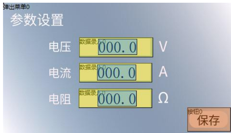
图 1 参数设置界面

参数设置界面如图 1 所示，该界面中有电压、电流、电阻三组参数需要设置，设置完成后点击“保存”按钮，将设置好的参数保存到数据库的指定位置。