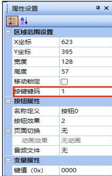
图 2 保存按钮键码值

弹出菜单控件用于弹出保存成功的提示框。此控件同样需要设置按键键码，但是功能与保存按钮完全不同，该按键键码用于软件方式触发弹出菜单功能。弹出菜单的按键键码设置如图 3 所示。